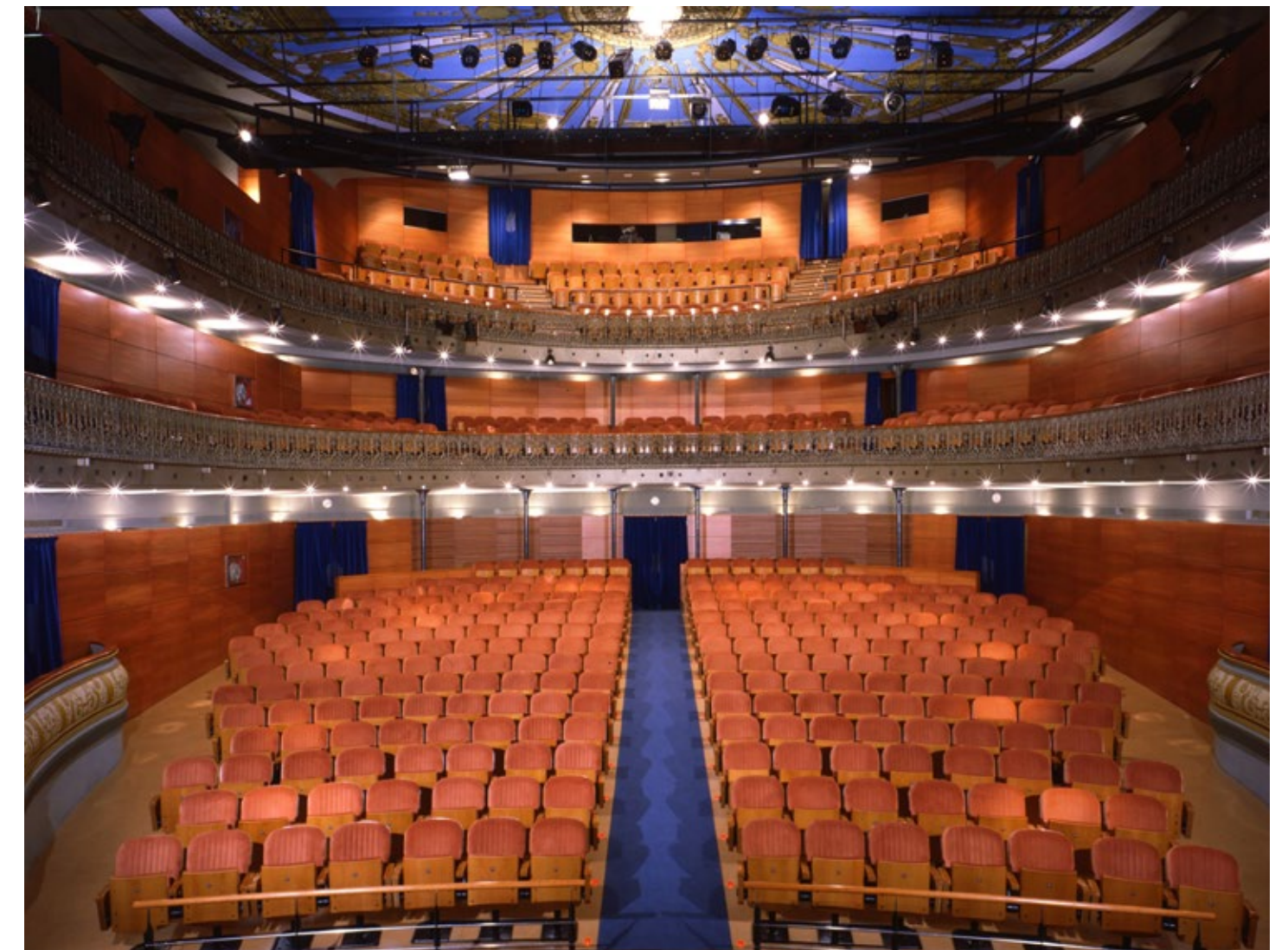
Le Teatre Romea, avant sa rénovation récente, avait déjà été équipé par Figueras en 2001.

À cette occasion, la direction du théâtre a choisi de préserver l'essence en conservant la conception du siège tout en actualisant le design et les matériaux. Le siège est tapissé de velours rouge fabriqué à partir de matériaux recyclés, s'éloignant du schéma de couleurs précédent. Le dossier et l'assise présentent une couture matelassée avec des coutures verticales pour un aspect rembourré et confortable. Le siège se replie automatiquement via un mécanisme actionné par une double charnière latérale, qui comprend