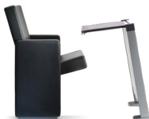
Flex 6036 + Table F1000