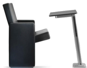
Flex 6036 + Table F48