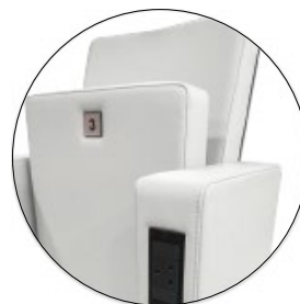
Possibilité d'intégrer une prise de courant, des connecteurs USB...