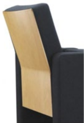
Dossier, siège et/ou panneaux avec finition en bois