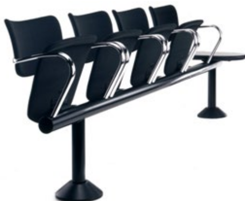
Delta FS 433